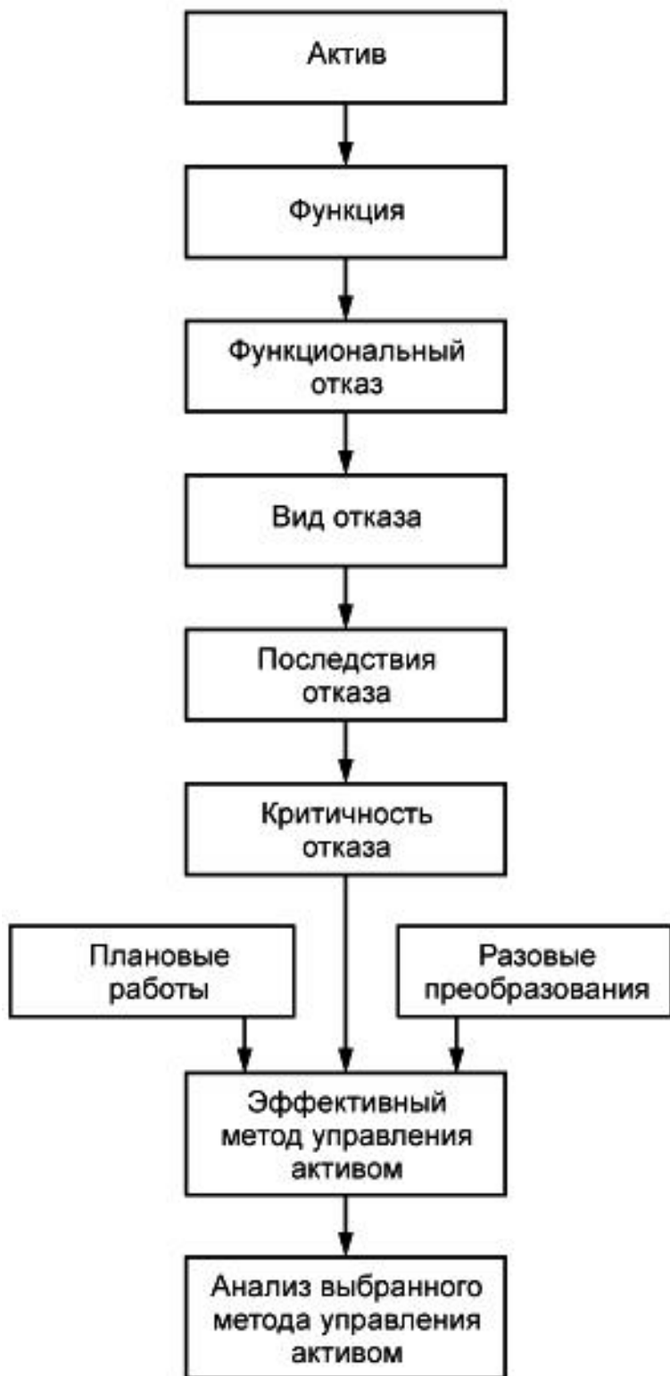
Рисунок А.1 - Блок-схема процесса НОТО